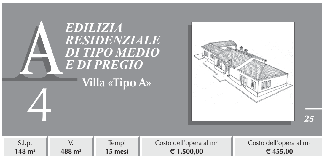
TABELLA RIASSUNTIVA DEI COSTI E PERCENTUALI D'INCIDENZA