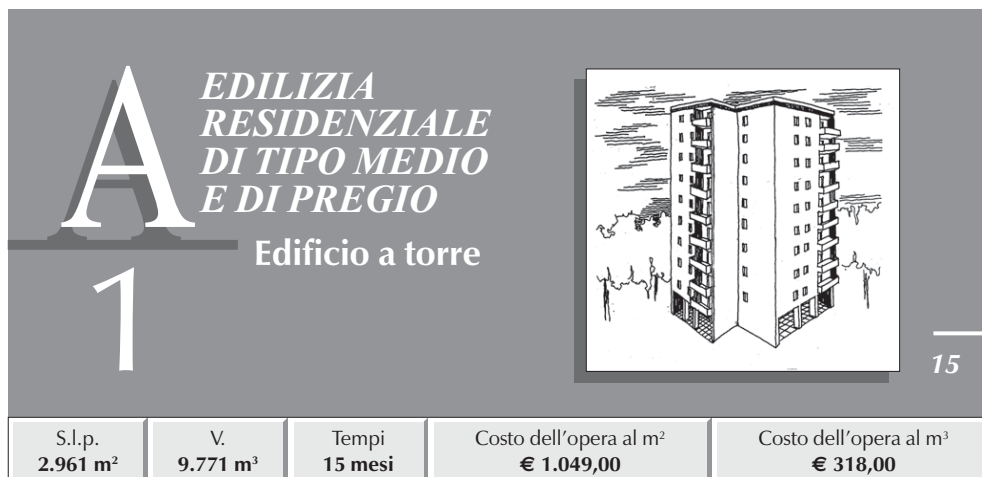
TABELLA RIASSUNTIVA DEI COSTI E PERCENTUALI D'INCIDENZA